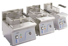
Freidoras profesionales de sobremesa