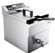
Freidoras de inducción