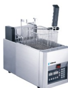
Freidora con cesta de elevación automática